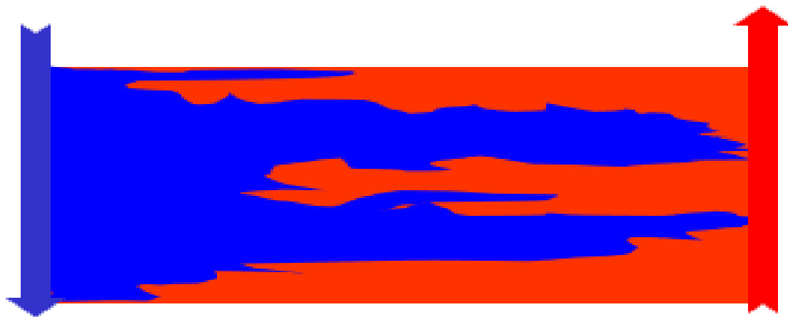
Оценка эффективности обработок

Обработки позволяют уменьшить темпы обводнения базового фонда и увеличить конечный КИН.